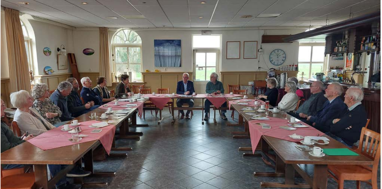
Reünie van oud-bestuursleden op 30 maart 2024 in Wehe-den Hoorn