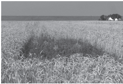
Leeuwerikvlakken zijn in graan uitgespaarde vlakjes van 20 m 2 .

In 2006 is veldonderzoek verricht voor het pilotproject Akkervogels. Dit project, met Duoranden en Leeuwerikvlakken, loopt sinds 2005 in de westelijke kustpolders, in de Lauerpolder en bij Spijk. Het project richt zich op akkervogels, vooral de veldleeuwerik. De eerste resultaten zijn veelbelovend.