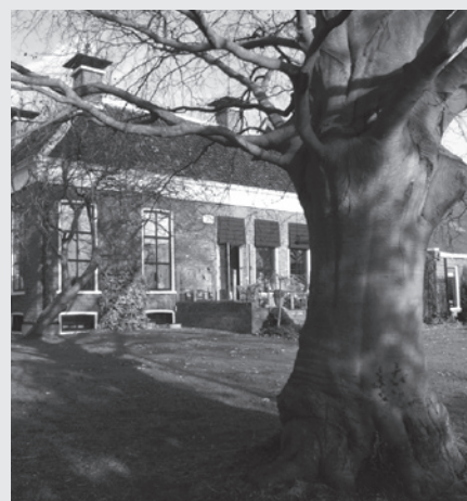
De eigen erven werden tijdens de excursiedag beoordeeld.

Heilien Tonckens, boerenervdeskundige, en Stieneke van der Wal van Landschapsbeheer gingen in een drietal theorieavonden in op de beplanting van het eigen erf en het onderhoud van de bestaande, vaak oude, singels. Tijdens de excursiedag maakten de 23 deelnemers een tocht langs eigen erven, hier werd duidelijk welke boom of struik geplant of gekapt kon worden. Met de "kritische" blik van Heilien werd naar de eigen aanplant gekeken.