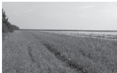
Een Duorand is een meerjarige akkerrand. Eén zijde wordt soms gemaaid, de andere zijde blijft lang en ruig.

De tussenrapportage van het veldonderzoek 2006 is in te zien op de site www.wierde-en-dijk.nl . Het veldonderzoek zal in 2007 en 2008 worden voortgezet.