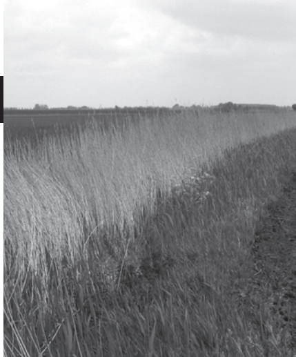
Deelnemers aan Kaantjes & Raandjes laten oud riet in de sloten staan.

Het rapport geeft tal van aanbevelingen om het areaal aan sloten met oud riet verder uit te breiden en te beheren. Er zijn goede vooruitzichten om het aantal broedende riet- en watervogels nog fors te doen toenemen. Uit provinciale gegevens gepubliceerd in het net verschenen rapport De Toestand van Natuur en Landschap 2006 in de provincie Groningen blijkt ook dat Noord-Groningen verhoudingsgewijs een grote populatie rietvogels heeft.