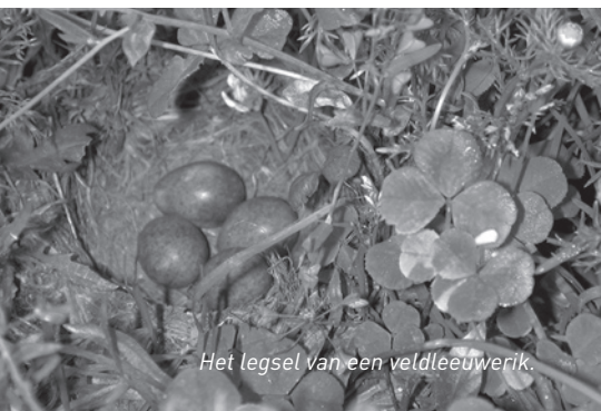
Het legsel van een veldleeuwerik.