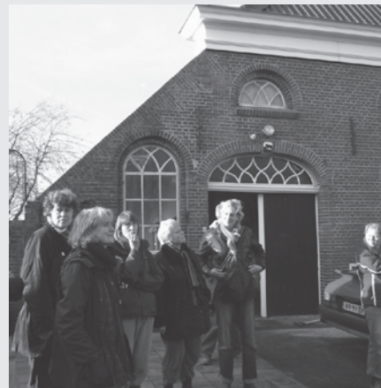
Veel animo voor Boerenervencursus afgelopen najaar.

In de afgelopen herfst organiseerde Landschapsbeheer Groningen samen met Wierde & Dijk een boerenervencursus. Hierin was specifieke aandacht voor het boerenerv in Noord-Groningen.