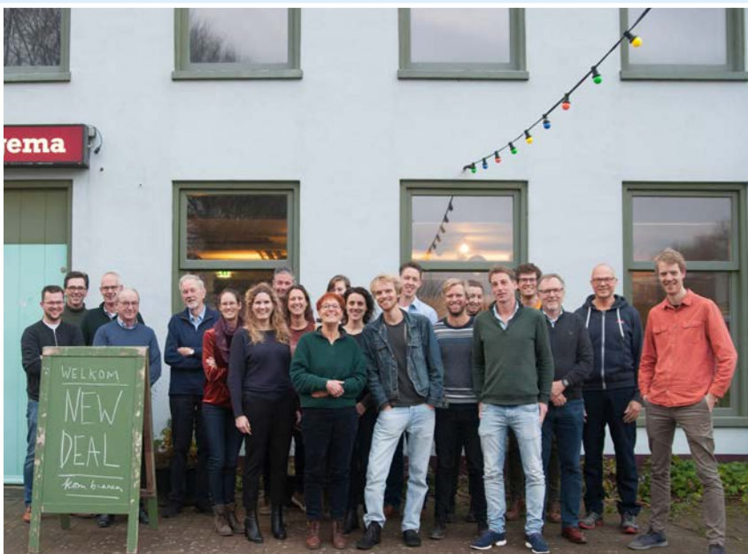
Deelnemers tweede werksessie in Hornhuizen

en -plannen waarmee weinig is gedaan. Laten we hopen dat deze New Deal wel een zinvolle bijdrage aan het debat en de samenwerking levert." ■