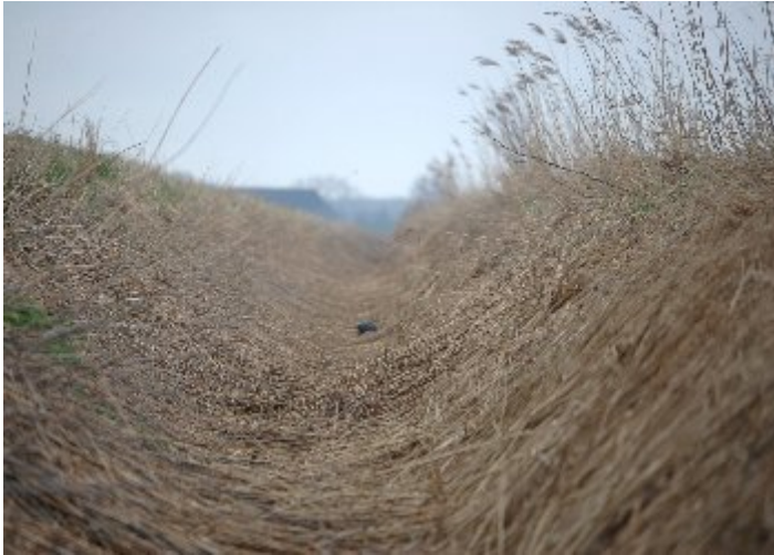
Voorbeeld van een schouwsloot waarin het oude riet op de taluds en slootbodem vrijwel geheel is platgeslagen als gevolg van langdurige sneeuwbedekking.

metingen aan winterpeilen ontbreken, evenals metingen naar het effect van het overjarige riet in beide experimentele vormen van onderhoud op de voersnelheid, met name na perioden met een piekbelasting in neerslag.