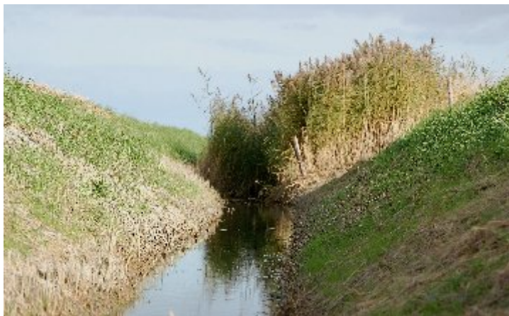
Een schouwsloot met gangbaar onderhoud waarvan een deel van het riet nog niet is gemaaid (oktober 2010). Het riet in de bovenste meter op het linker talud is eerder in de zomer al gemaaid.