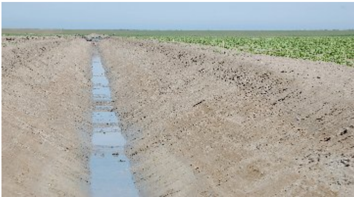
Een kenmerkend slootprofiel in het onderzoeksgebied.

Om te weten of de geselecteerde schouwsloten met een vorm van experimenteel onderhoudsbeheer een representatieve afspiegeling vormen van de schouwsloten, zijn de gemeten slootkenmerken en waterpeilen vergeleken met schouwsloten die jaarlijks worden geschoond (controlesloten). Tussen beide sloottypen zijn geen significante verschillen gemeten in gemiddelde bodembreedte, taludhoogten en totale slootbreedte (tab.1), tussen de waterpeilen in april, mei en juli (tab.2) en in dikte van de sliblaag (tab.3). In de dikte van de sliblaag zijn geen significante verschillen gemeten hoewel het hogere gemiddelde in de schouwsloten met een vorm van onderhoudsbeheer anders doet vermoeden. Het beeld wordt vertekend door een tweetal sloten met sterk afwijkende waarden. In deze twee sloten is een sliblaag van 30 en 40cm gemeten. Kortom, bij de gemeten kenmerken zijn geen noemenswaardige verschillen vastgesteld tussen schouwsloten met of zonder één van de twee onderzochte vormen van onderhoudsbeheer.