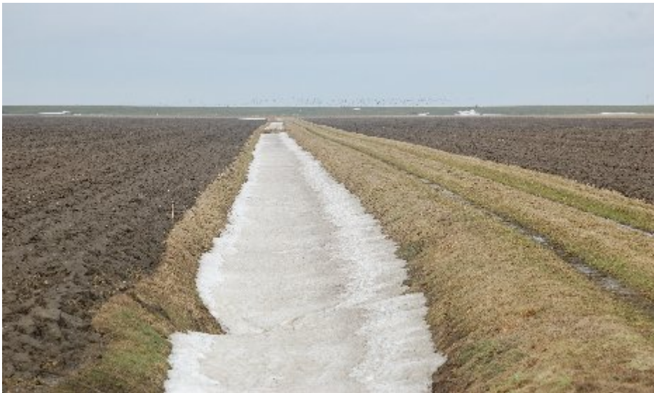
..... in de winter