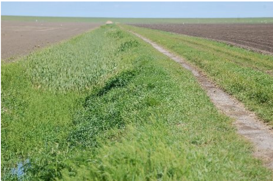
..... en in het voorjaar.