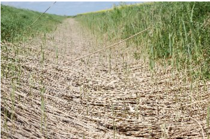
Schouwsloot met platgeslagen oud riet waar het jonge riet door opkomt.

De langdurige sneeuwbedekking in de winter van 2009/'10 is van grote invloed geweest op de kwaliteit van het overjarige riet. In bijna de helft van de sloten met overjarig riet was het riet volledig platgeslagen en in een kwart gedeeltelijk. Alleen bij de talrijkste broedvogel, de kleine karekiet, is een significant hogere broeddichtheid vastgesteld in schouwsloten met de experimentele onderhoudsvormen. Tussen de twee onderzochte vormen van onderhoudsbeheer is bij geen enkele vogelsoort een verschil in broeddichtheid gemeten. De kleine verschillen worden geheel toegeschreven aan de geringe oppervlakte overjarig riet dat na de winter nog overeind stond en geschikt was om in te broeden.