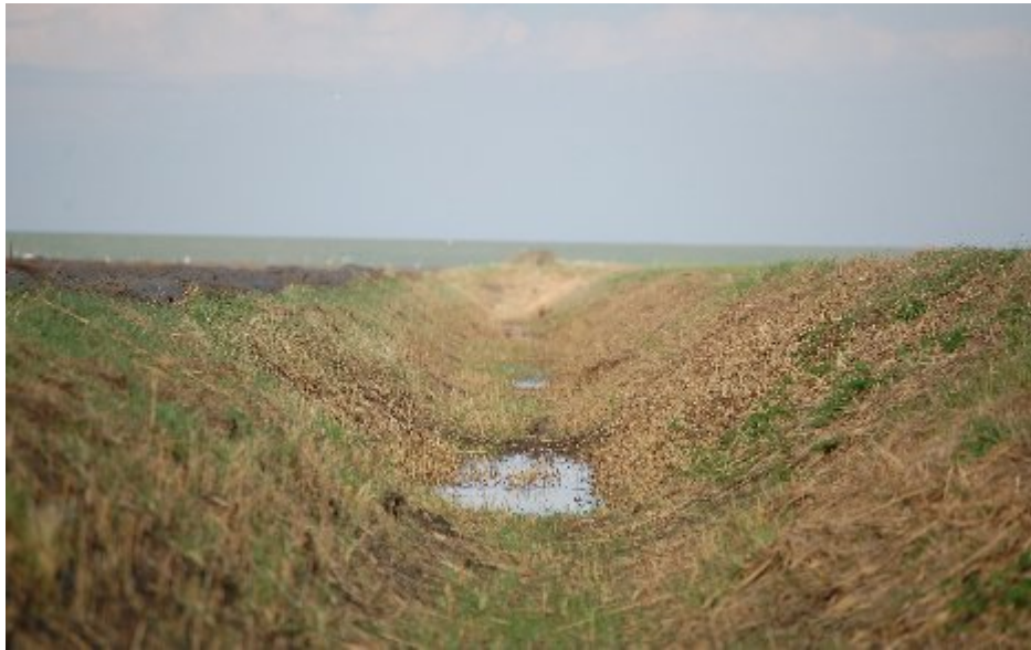
Voorbeeld van een schouwslot met traditioneel onderhoud.....in het najaar