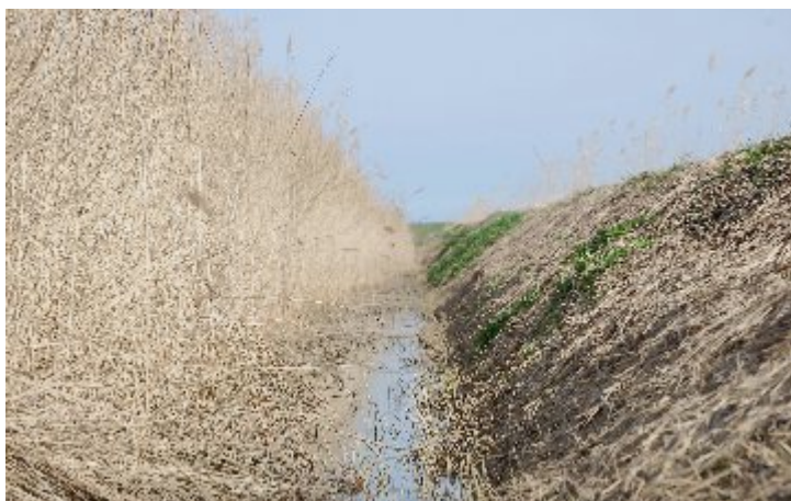
Voorbeeld van de onderhoudsvorm waarbij het oude riet in de helft van de schouwsloot blijft staan.

Het effect van de rietgroei op de doorstroming is in het eerste jaar nog niet onderzocht. In het eerste jaar zijn alleen gedurende het broedseizoen de waterpeilen gemeten. Met een gemiddeld waterpeil van 14cm staat aan het begin van het broedseizoen, in april, in het algemeen weinig water in de sloten. In de loop van de zomer vallen veel sloten droog tot nagenoeg droog. In juli staat het peil gemiddeld 10cm lager dan in april en mei. In de diep ontwaterde sloten staat het peil in het voorjaar gemiddeld 170cm onder het maaiveld. Het vele platgeslagen riet in de sloten heeft voor de oeverigenaren niet tot ongewenste situaties geleid.